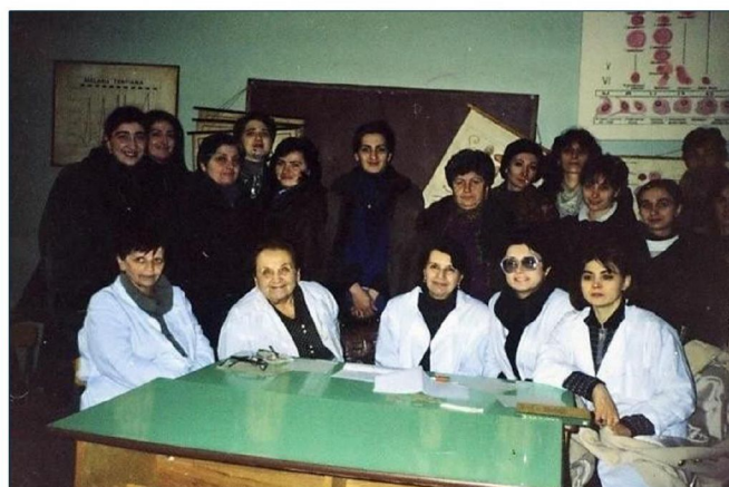
1990-2000 წწ. — კლინიკო-ლაბორატორიული დიაგნოსტიკის კათედრა