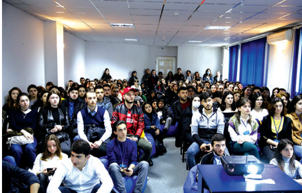
2019 წლის 19 აპრილს, ევროპის იმუნიზაციის კვირეულთან დაკავშირებით, თსუ-ის სტუდენტური თვითმმართველობის

ლექციის შემდეგ, კლუბ „მედისინემას“ მხარდაჭერით, მოენყო კინოჩვენება „Rain on fire“, რომელიც დაფუძნებულია სუზანა კოჰელანის რეალურ ამბავზე და იმ „მაგიურ დაავადებაზე“, რომელსაც კოჰელანი ებრძოდა.