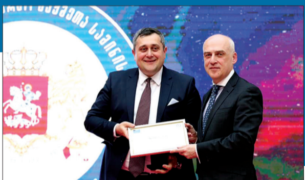
უნივერსიტეტის სტიპენდიანტი სტუდენტებისა და ექიმი რეზიდენტებისთვის.

გიორგი გრიგოლიას ძალისხმევით და გერმანული კოლეგების დახმარებით დაარსდა გიორგი გრიგოლიას სახელობის პროგრამა, რომლის საშუალებით, ბოლო 15 წლის მანძილზე, დაახლოებით 400 სტუდენტს და ახალგაზრდა ექიმ-რეზიდენტს, როგორც ამ პროგრამის სტიპენდიანტს, მიეცა ცოდნის გაღრმავების შესაძლებლობა მიუნხენის უნივერსიტეტის ცენტრალურ და აკადემიურ კლინიკებში. აღსანიშნავია ისიც, რომ სწორედ ამ პროგრამის ფარგლებში, დაახლოებით 500 000 ევროს ოდენობის ფინანსური და მატერიალური დახმარების განევა მოხერხდა ჩვენი