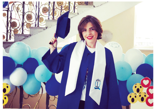
2019 2019 Comment 2019