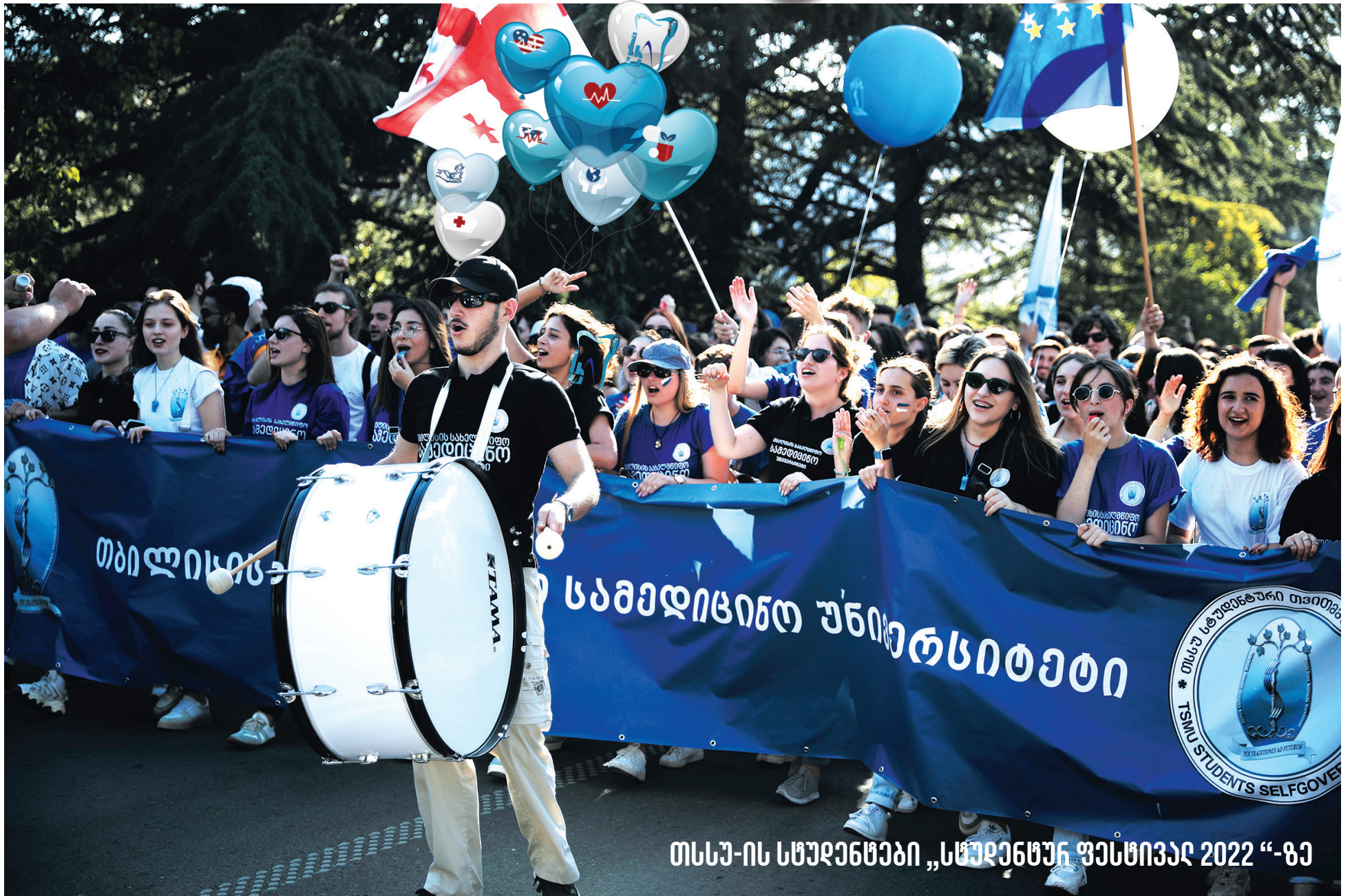
თსსუ-ის სტუდენტები „სტუდენტურ ფესტივალ 2022“-ზე

თბილისის სახელმწიფო სამედიცინო უნივერსიტეტის გაგაცემა გამოდის 1957 წლიდან № 7 (355) სექტემბერი, 2022 წელი