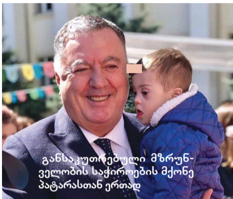
განსაკუთრებული მზრუნველობის საჭიროების მქონე პატარასთან ერთად

მაგალი ექიმები, სტომატოლოგები, რეაბილიტოლოგები, საზოგადოებრივი ჯანდაცვის სპეციალისტები, ფარმაცევტები, ბაკალავრი