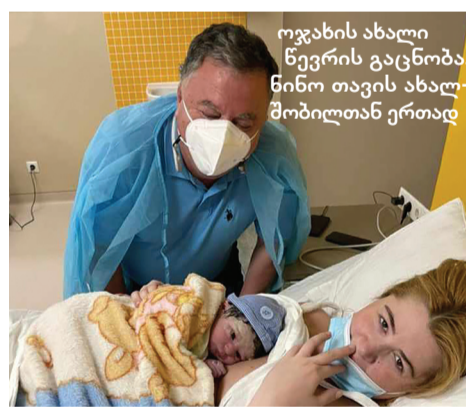
ოჯახის ახალი წევრის გაცნობა. წინო თავის ახალშობილთან ერთად