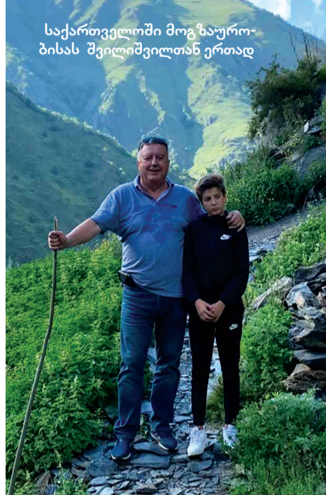
საქართველოში მოგზაურობისას შვილიშვილებთან ერთად