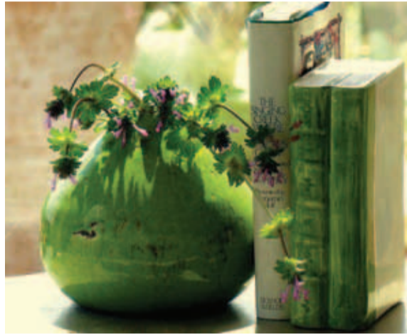
პროფესორმა, დამსწრე საზოგადოებას საინტერესო მოხსენება შესთავაზა – ბიოჰუმექტურა – ტკივილის მართვა მწვავე

თბილისის სახელმწიფო სამედიცინო უნივერსიტეტში ახლახან გამართული საერთაშორისო სკოლა-სემინარის სტუმარმა, სიდ ჰარტ ჰოპარტიმ, – ვიტენ-ჰერდვის, ბონის, მილანის და ვიადრის უნივერსიტეტების