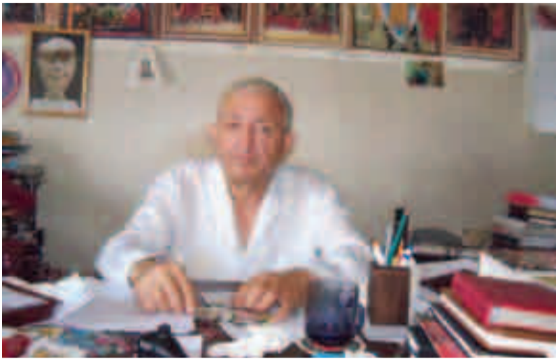
(დასასრული; დასაწყისი იხ. „სამედიცინო გაზეთი“ №№4,5, 2011 წ.)

ვიშნევსკის სახელობის ინსტიტუტში დავესწარი რამდენიმე საჩვენებელ კონფერენციას გულსა და ფილტვებზე. თბილისში დაბრუნებისთანავე გამოვაქვეყნე წერილი „კიბერნეტიკა და მედიცინა“ („მედიცინის მუშაკი“, 1963 წელი, №8). მოგვიანებით კი, სტუდენტთა სამეცნიერო საზოგადოების ეგიდით, რომლის თავმჯდომარეც მაშინ ვიყავი, ჩავატარე კონფერენცია თემაზე – „კლინიკური მედიცინა და კიბერნეტიკა“, რაც ამ მიმართულებით გამართული პირველი კონფერენცია გახლდათ კავშირის მასშტაბით. კონფერენციის ჩატარება განსაკუთრებული სიხარულით აღიქვა ინსტიტუტის მედიცინის ისტორიის კათედრის გამგემ, პროფესორმა მიხეილ სააკაშვილმა. ბატონ მიხეილს დავუახლოვდი სტუდენტთა სამეცნიერო საზოგადოების საბჭოს თავმჯდომარედ მუშაობის პერიოდში. უნდა ითქვას, რომ იგი იყო შესანიშნავი ექიმი, პედაგოგი და მეცნიერი. მისი ხელმძღვანელობით, ი. თარხნიშვილის სახელობის სტუდენტთა სამეცნიერო საზოგადოების ეგიდით, მოვაზადეთ და წარმატებით ჩავატარეთ რამდენიმე გამსვლელი კონფერენცია საქართველოს რაიონულ ცენტრებში.