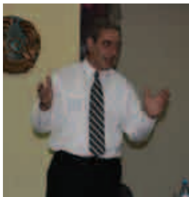
ყაზახეთის ჯანდაცვის სამინისტროს და ონკოლოგიურ პაციენტთა მხარდაჭერის საზოგადოებრივ ფონდ -

„ზდოროვია აზიას“ მიწვევით, ყაზახეთში იმყოფებოდა თბილისის სახელმწიფო სამედიცინო უნივერსიტეტის ონკოლოგიის დეპარტამენტის პროფესორი, საქართველოს ეროვნული პრემიის ლაურეატი, საქართველოში პალიატიური მზრუნველობის სფეროს ერთ-ერთ ორგანიზატორი, ბატონი მიხეილ შავდია . მან 14-15 ივნისს ალმა-ათაში ჩაატარა მასტერ-კლასი თემაზე „ პალიატიური მზრუნველობა: ბავშვთა პალიატიური მზრუნველობის სამსახურის ორგანიზება ყაზახეთში “.