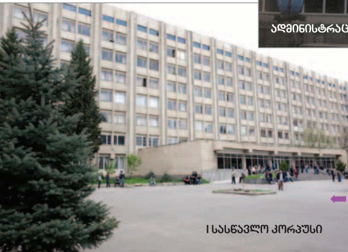
I სასწავლო კორპუსი