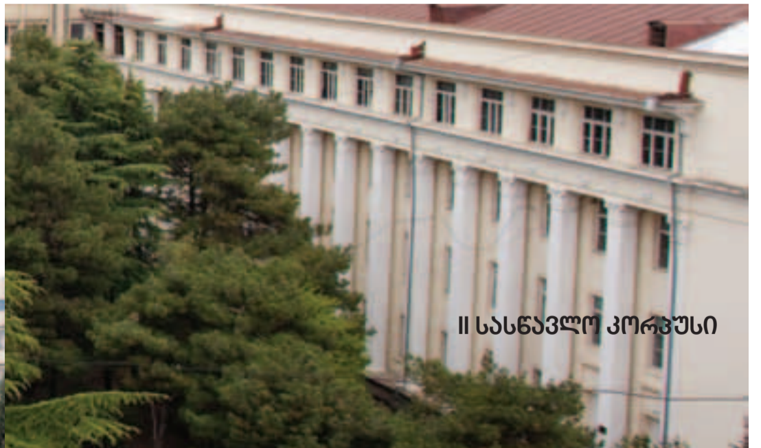
II სასწავლო კორპუსი