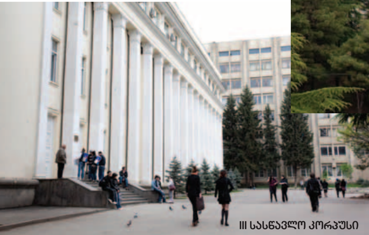
III სასწავლო კორპუსი