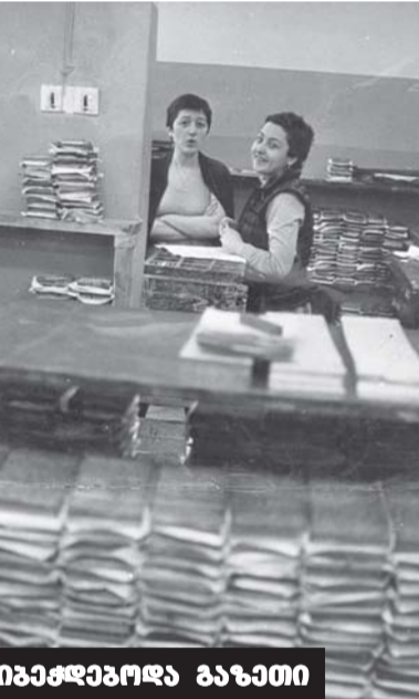
ამ იზაქაბოლა გაზეთი

დრო მიქროდა... კვალდაკვალ მიჰყვებოდა „მედიცინის მუშაკიც“. 90-იან წლებში კომუნისტური რეჟიმის მსხვერვატზე ახალი ენა შექმნა... თბილისის სახელმწიფო სამედიცინო ინსტიტუტს ენიჭება დამოუკიდებელი უნივერსიტეტის სტატუსი. რა თქმა უნდა, ყველა რგოლთან ერთად, დღის წესრიგში დადგა საუნივერსიტეტო ბექდებით ორგანოს ახლებურად, დროის მოთხოვნათა შესაბამისად, გარდაქმნა, რაშიც უდიდესი წვლილი მიუძღვის თსუ-ის მაშინდელ რექტორს, პროფესორ რამაზ ხეცურაიანს და პრორექტორს იდეოლოგიურ დარგში, პროფესორ დავით გეგეშიძეს.