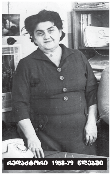
რედაქტორი 1958-79 წლებში

დამტკიცდა წესდება, რეგლამენტი, განისაზღვრა პერიოდულობა, გვერდების რაოდენობა (8-დან 12-მდე), ტირაჟი (1000 ც.), შტატი (7 თანამშრომელი: რედაქტორი, ოთხი კორესპონდენტი, მდივანი-მემანქანე, ფოტო-კორესპონდენტი). განახლებული გაზეთი რეგისტრაციაში გაატარა საქართველოს ოქსტიციის სამინისტრომ ფორმულირებით - „თბილისის სახელმწიფო სამედიცინო უნივე-