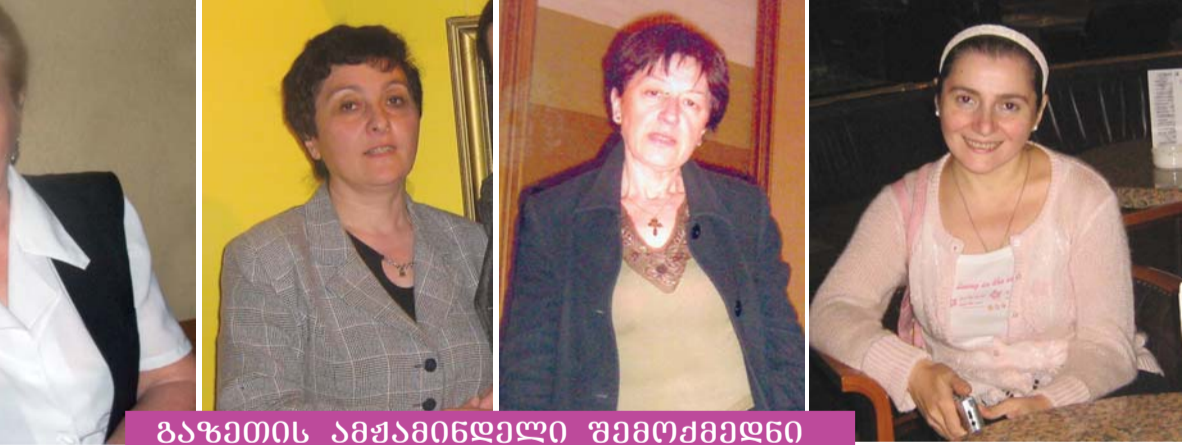
გაზეთის ამჟამინდელი შემოქმედნი