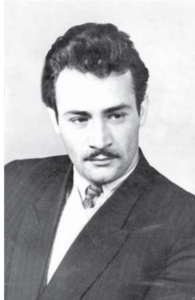
1957 წლის 8 აპრილს, მედიკოსების ქუჩაზე მდებარე სამედიცინო ინსტიტუტის ხელმძღვანელობამ, სტუდენტებმა თ-