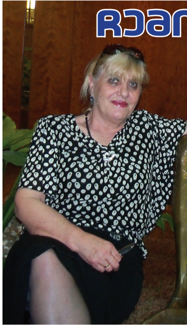
გალმა, რომ უცხო ნაპირი მოსწონს, მხოლოდ იმ მხარეს გადაფრინდება...