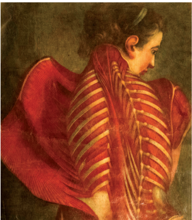
ანატომიური ატლასი, 1746-48 წწ. ყდა და სატიტულო გვერდი, ილუსტრაციები.