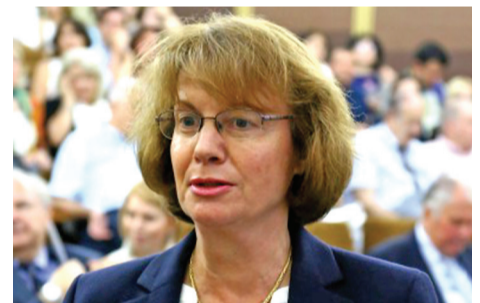
გერმანიის ფედერაციული რესპუბლიკის საგანგებო და სრულუფლებიანი ელჩი საქართველოში, დოქტორი შაიკე პაიჩი

ვერსიტეტში უცხოელმა პროფესორებმა ნაიკითხეს ლექციები.