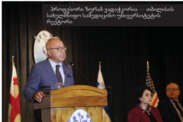
პროფესორი ზურაბ ვადაჭკორია — თბილისის სახელმწიფო სამედიცინო უნივერსიტეტის რექტორი