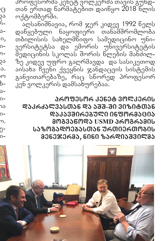
პროფესორ კენეტ ვოლკერის დაკარგვასთან და აშშ-ში ვიზიტთან დაკავშირებული ინფორმაცია მოგვამოდო USMD პროგრამის საზოგადოებასთან ურთიერთობის მენეჯერმა, ნინი ზარდიაშვილმა

პროფესორმა ზურაბ ვადაჭკორიამ და ემორის უნივერსიტეტის მედიცინის სკოლის დეკანმა, ვიკას სუხათიმომ, ისაუბრეს, ერთი მხრივ, თბილისის სახელმწიფო სამედიცინო უნივერსიტეტსა და ემორის უნივერსიტეტის მედიცინის სკოლას შორის, თსუ-ის დიპლომირებული მედიკოსის ამერიკული პროგრამის ფარგლებში, ურთიერთთანამშრომლობის კიდევ უფრო გაღრმავებაზე და, მეორე მხრივ, ჯანდაცვის სფეროს სხვა მიმართულებების განვითარებაზე, მათ შორის, ფიზიკური რეაბილიტაციის პროექტის განხორციელების შესახებ საქართველოში: 2017 წელს USAID-ის მიერ გამოცხადებულ კონკურსში გამარჯვების შემდეგ ემორის უნივერსიტეტმა თსუ-ის ფიზიკური მედიცინისა და რეაბილიტაციის ფაკულტეტის აკადემიურ პერსონალთან, კორპორაცია „პარტნიორები საერთაშორისო განვითარებისათვის“ საქართველოს წარმომადგენლებასა და ორგანიზაციას - „კოალიცია დამოუკიდებელი ცხოვრებისათვის“ ერთად საქართველოში რეაბილიტაციის დარგის განვითარება დაიწყო. პროექტის განხორციელება პროფესორმა კენეტ ვოლკერმა თავის გუნდთან ერთად წარმატებით დაიწყო 2018 წლის ოქტომბერში.