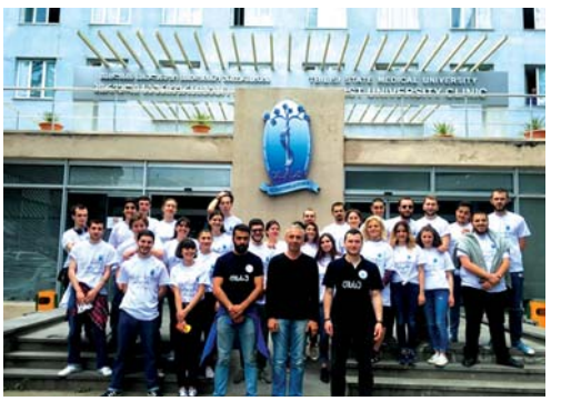
ების გარემოსდაცვითი პასუხისმგებლობის ამაღლება.

2018 წლის 5 ივნისს, გარემოს დაცვის საერთაშორისო დღესთან დაკავშირებით, თბილისის სახელმწიფო სამედიცინო უნივერსიტეტის პირველი საუნივერსიტეტო კლინიკის ეზოში გაიმართა დასუფთავების აქცია. ღონისძიების ორგანიზატორი თბილისის სახელმწიფო სამედიცინო უნივერსიტეტის სტუდენტური თვითმმართველობის საინიციატივო ჯგუფი — „სტუდენტები სტუდენტებისთვის“ იყო.