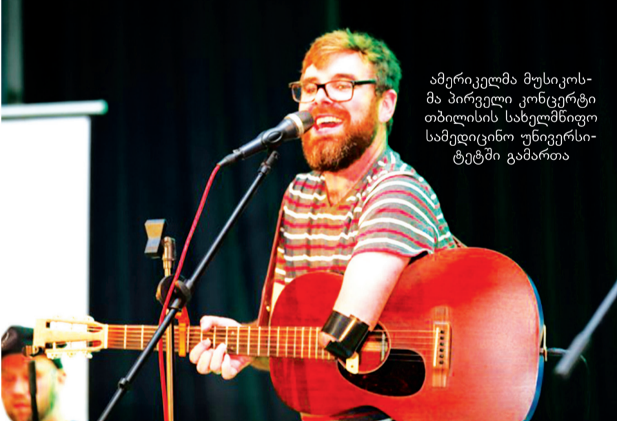
ამერიკელი მუსიკოს-მა პირველი კონცერტი თბილისის სახელმწიფო სამედიცინო უნივერსიტეტში გამართა

მნიშვნელოვანი და სასიხარულოა, რომ ამერიკის შეერთებულ შტატებში თსუ-ის სიმღერის და ცეკვის სახალხო ანსამბლის წარმატებული კონცერტების შემდეგ კულტურული ურთიერთობები ორ ხალხს შორის გრძელდება, რისი დასტურიცაა 15 აპრილს თბილისის სახელმწიფო სამედიცინო უნივერსიტეტში გამართული ამერიკელი მუსიკოსის და კომპოზიტორის, ტონი მემელის, კონცერტი, რომელიც ამერიკის შეერთებული შტატების საელჩოს მონაწილეობით, პროექტის – „ამერიკული მუსიკა საზღვარგარეთ“ – ფარგლებში ესტუმრა საქართველოს და რაოდენ მნიშვნელოვანია, რომ პირველი კონცერტი სწორედ თბილისის სახელმწიფო სამედიცინო უნივერსიტეტში გამართა. აღსანიშნავია, რომ ტონი მემელი, გარდა იმისა, რომ პროფე-